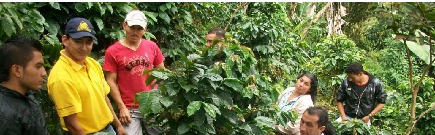
Capacitación en recolección. Vereda el Cucho Municipio de Rosas