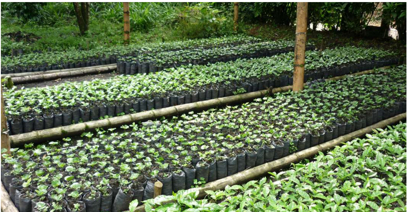
Cuadro 6. Inversión total del proyecto PFGB