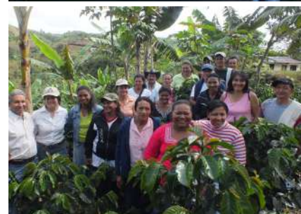
Proyecto Escuela y Café. Institución Educativa Nuestra Señora del Rosario. El Rosario -Cajibío.