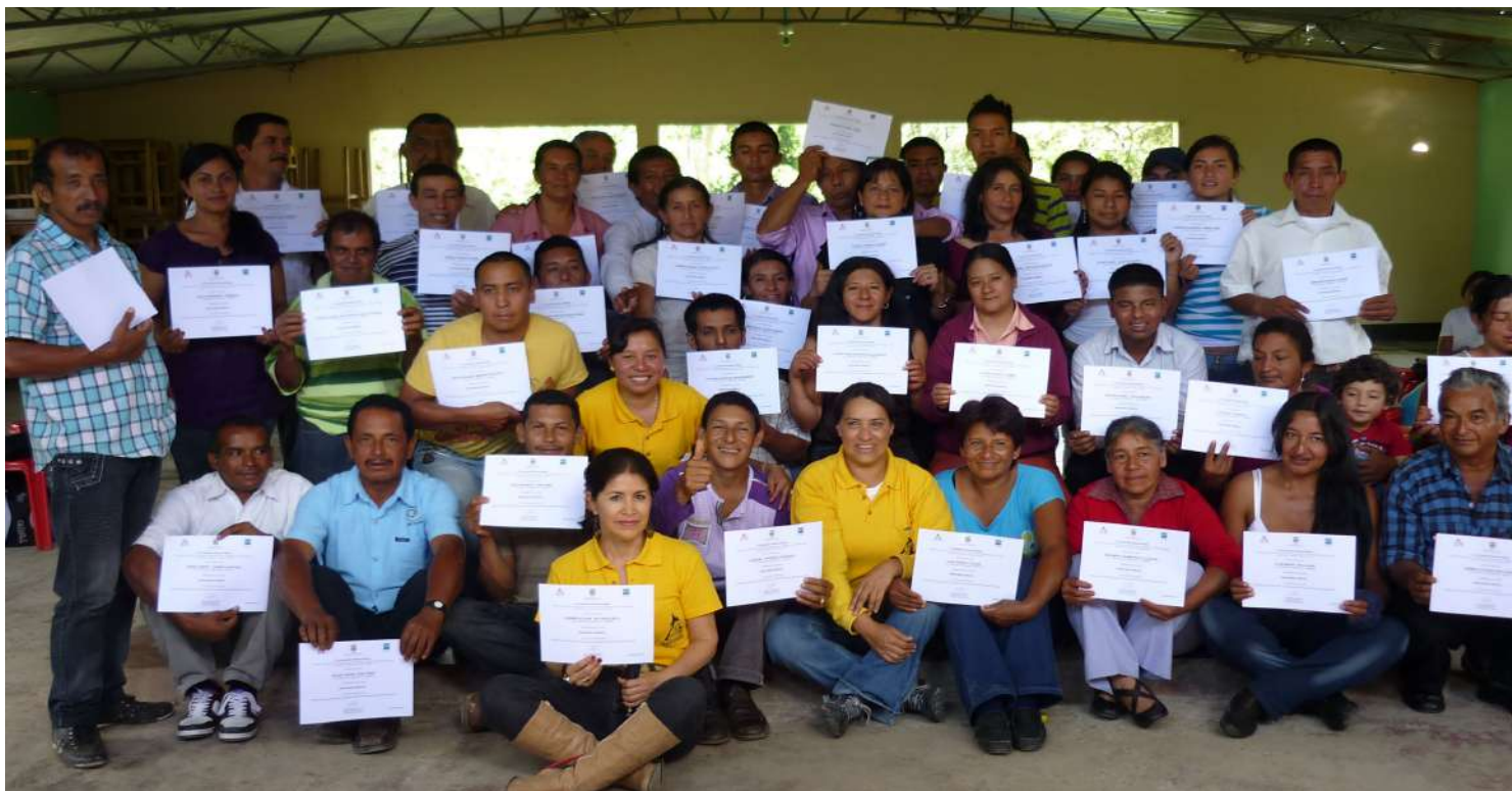
Ceremonia graduación curso de informática básica Proyecto Cafeteros Conectados- Municipio El Tambo.