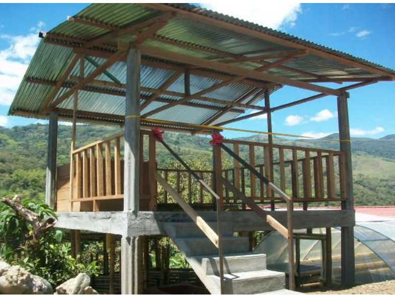
Beneficiario proyecto Mitsubishi. Municipio de Rosas